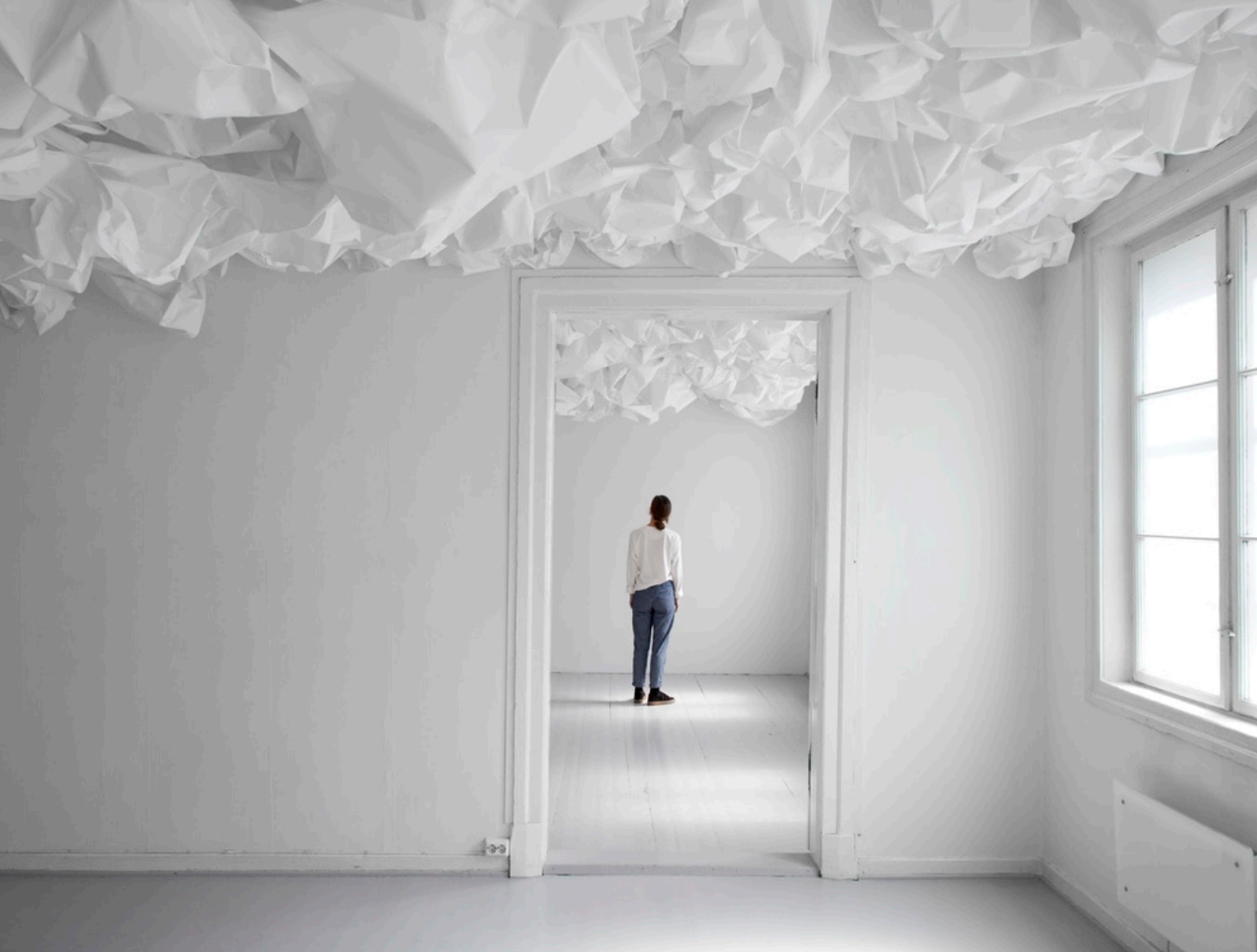
Bilde: Marit Roland, Paperdrawing #21 juni 2017